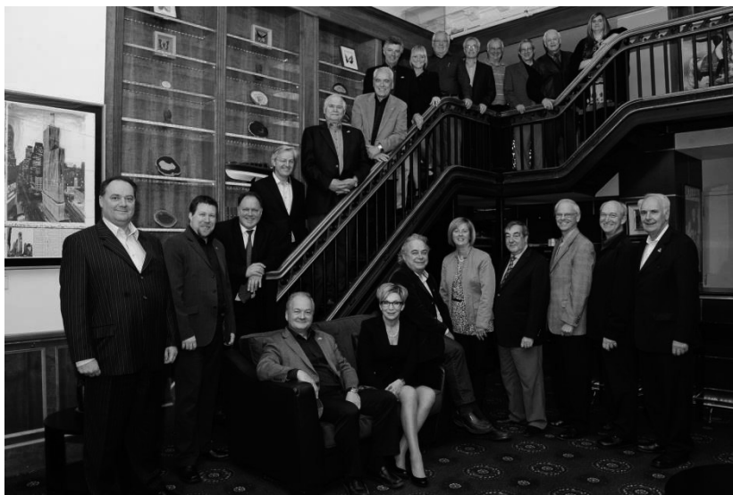
Conseil national – Réseau M, printemps 2012