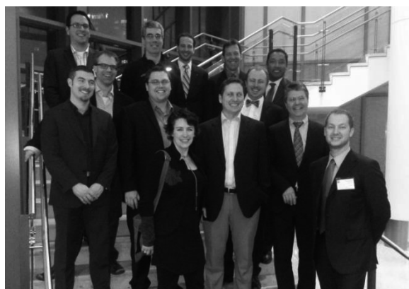
La cohorte 6 lors de son passage au MIT Sloan School of Management en janvier 2013

« Excellente formation : A+ Étant à la base un entrepreneur axé sur des compétences technologiques, comme plusieurs autres entrepreneurs, j'ai personnellement appris beaucoup sur la conduite des affaires et sur mon rôle et mes responsabilités de CEO pour le développement stratégique de ma société. »